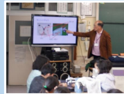
特別授業「ホタルを知ろう！」