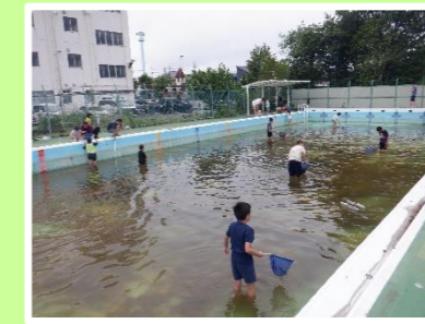
おやじの会による「ヤゴ救出大作戦」