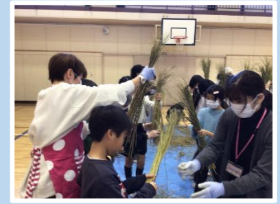
しめ縄づくり体験