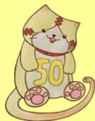
50周年キャラクター 「にゃにゃごろろう」誕生