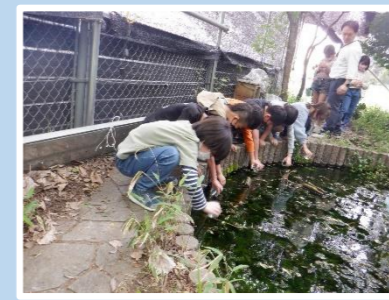
ホタルの幼虫の放流