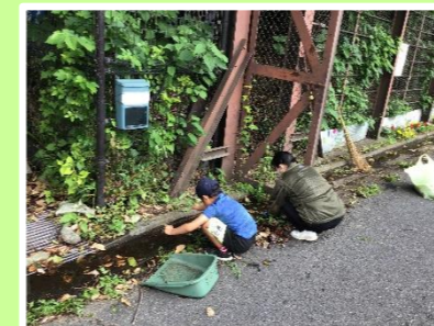
美花倶楽部による清掃活動