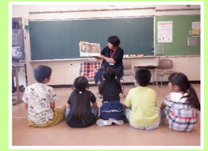
Yonder!による昼休みの読み聞かせ