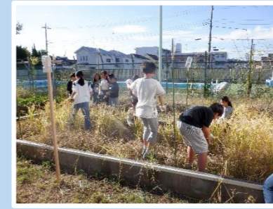
学校田を使った稲作体験