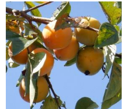
色づき始めた柿の実

つい先日まで鳴いていたセミの声が今は全く聞こえてこなくなり、キンモクセイの花の香りが漂っています。学校の敷地には、柿やヒメリンゴ、ナツメの実が色づき、クヌギの木のドングリがたくさん落ちています。まだまだ気温が高い日もありますが、秋の気候になってきています。秋はその過ごしやすい気候から、スポーツの秋、芸術の秋、など「○○の秋」と言われます。福生第七小学校でも運動会や学習発表会等様々な学校行事を予定しております。